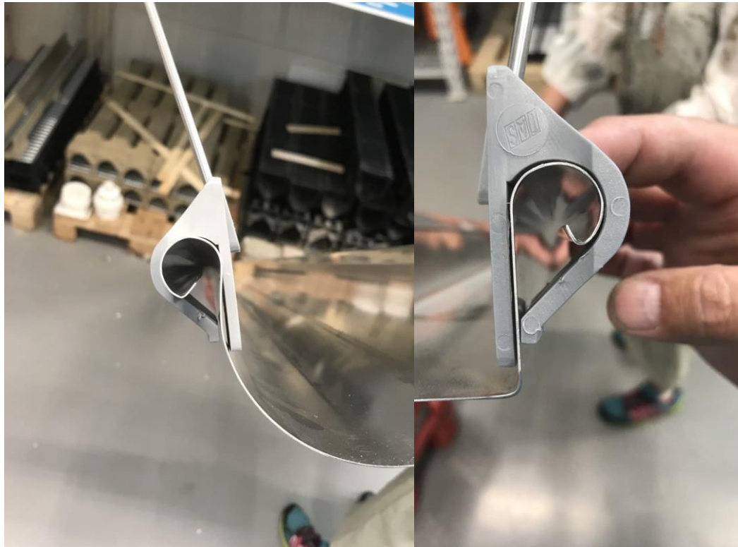
Dachrinnenträger montiert auf Dachrinne RG 75 - RG125 / D1 16-18 mm